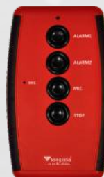
Standard so štyrmi tlačidlami