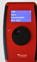
Professional s displejom a enkodérom

Diaľkové ovládania môžu byť vybavené snímačom RFid kariet pre identifikáciu obsluhy a zabezpečenie aktivácie iba autorizovanými osobami. Obidva typy majú zabudovaný mikrofón a umožňujú aj vysielanie živých hlásení.